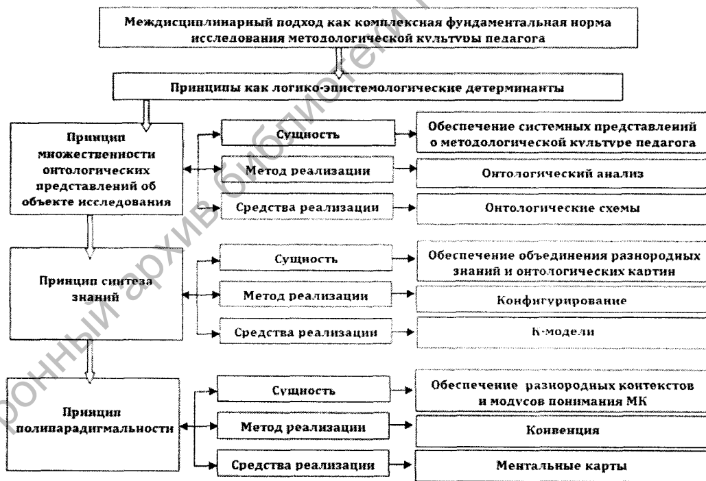
Рисунок 1 – Схема «Гносеологические детерминанты изучения методологической культуры»

ческими детерминантами междисциплинарного подхода в исследовании методологической культуры педагога выступает система взаимосвязанных принципов множественности онтологических представлений об объекте исследования, синтеза знаний и полипарадигмальности. Определяя принципы как логико-эпистемологические детерминанты исследования, мы опираемся на теорию концептуальной трансдукции (переход от одних концептов к другим) В. А. Канке. Согласно данной науковедческой теории, принципы выступают важнейшими концептами структуры теории [5]. С нашей точки зрения, вышеуказанные принципы соответствуют требованиям независимости, непротиворечивости и полноты описания на этапе дескриптивной реконструкции методологической культуры педагога. Если принять позицию о том, что основная проблема логики – это проблема метода, то на ее основе устанавливается связь: принцип-метод-когнитивный конструкт. Методы позволяют объективировать принципы и реализовать их в исследовании с помощью средств – схем как когнитивных конструктов (рисунок 1).