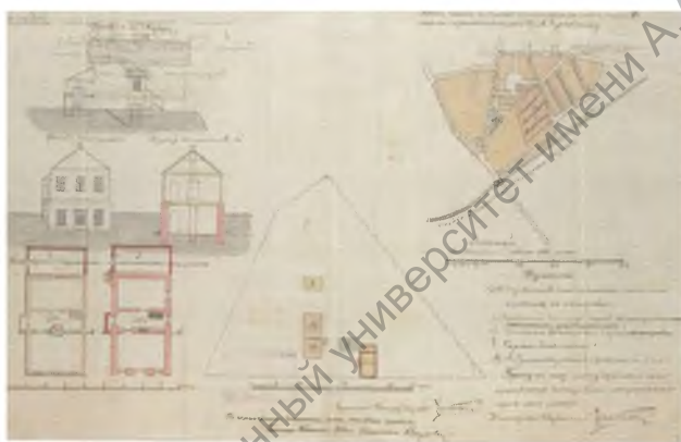
Рисунок 3. План дома и участка в г. Минске по ул. Захарьевская, 18, до 1917 г. [3, с. 351]

Благодаря щепетильным научным изысканиям Леонида Морякова, посвятившего многие годы изучению главной улицы Минска, в чьей книге встречается описание технических характеристик и месторасположения дома № 18 по ул. Захарьевской, принадлежащего Чернявскому С.К., мы знаем, что ныне на этом месте, как указывает историк, находится главный корпус Белорусского государственного педагогического университета имени Максима Танка [3, с. 94–97, 101].