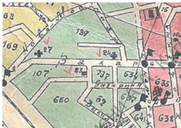
Рисунок 1. План г. Минска (ул. Захарьевская) до 1917 г.

костёлом Симеона и Елены, что располагался на углу Захарьевской и Трубной, а также двумя православными храмами, большой из которых – Привокзальная Казанская церковь – стоял на углу Захарьевской и Ново-Московской. В отчёте одного православного священника мы читаем: «Помещение молельни адвентистов находится... посредине между Привокзальной церковью и церковью при училище слепых – только с противоположной стороны» [5, л. 40 об].