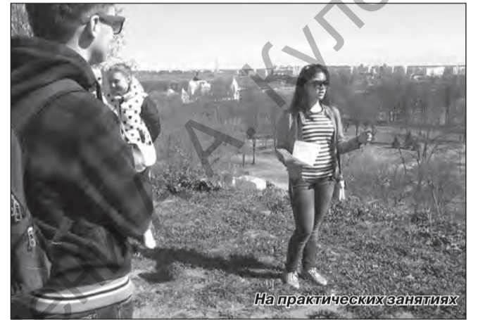
На практических занятиях

На сегодняшний день на факультете естествознания обучается 22 иностранных гражданина. Они приехали из Туркменистана и являются активными участниками как учебного процесса, так и воспитательных, спортивных, экологических мероприятий. С интересом изучают историю и культуру Беларуси и города Могилева.