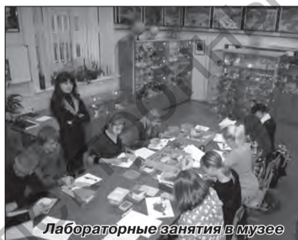
Лабораторные занятия в музее

Знания об окружающем мире чрезвычайно многогранны. Геологические знания имеют важное мировоззренческое значение как в системе интеллектуального развития личности, так и в повышении экологической безопасности общества. Расширение кругозора за счет ознакомления со строением и свойствами минералов и горных пород формирует устойчивую основу понимания свойств многих объектов, окружающих нас, и процессов, протекающих постоянно в окружающем мире. Эти знания имеют и практическое значение. Правильный выбор камня для отделки дома, знание правил ухода за ювелирными изделиями не только способствуют рациональному вложению средств, но и дают возможность передать эти знания. Одним из важнейших условий формирования глубоких и всесторонних знаний о строении, составе минералов и горных пород, процессах их образования и разрушения является возможность увидеть данные геологические объекты и получить начальную информацию о них. Такую возможность предоставляет своим посетителям кабинет-музей геологии и палеонтологии МГУ имени А.А. Кулешова.