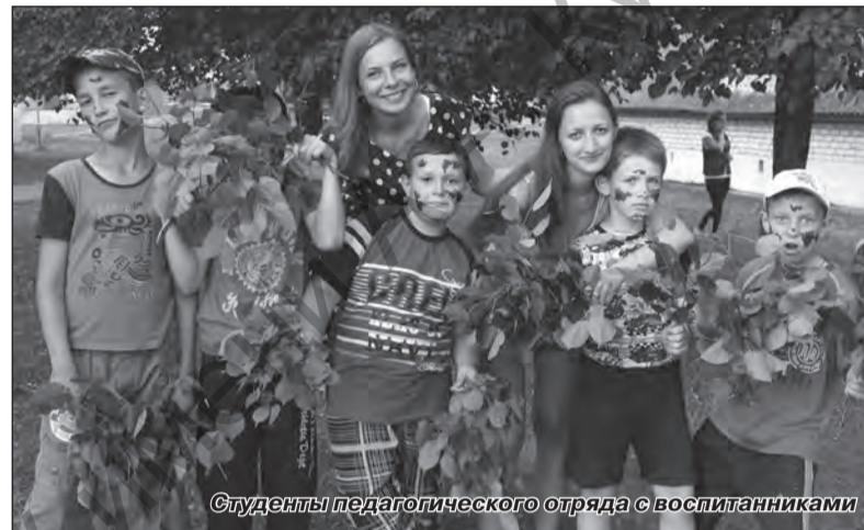
Студенты педагогического отряда с воспитанниками

Трудовой семестр нынешнего года ознаменован 70-летием Великой Победы. В этой связи было принято решение всем трудовым отрядам присвоить имена героев Великой Отечественной войны.