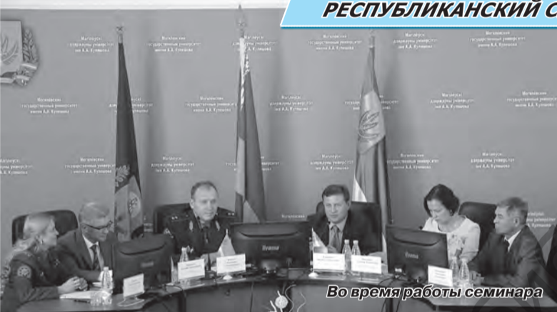
Во время работы семинара

3-4 июня 2015 года на базе Могилевского государственного университета имени А.А. Куляшова состоялся Республиканский семинар «Актуальные вопросы безопасной жизнедеятельности воспитанников в учреждениях дошкольного образования». Участники семинара посетили Музей истории пожарной службы Могилевщины. Большой интерес вызвала выставка учебно-методического и предметно-игрового материала, разработанного учреждениями дошкольного образования в рамках проходившего в 2014 году Республиканского конкурса «Безопасное детство».