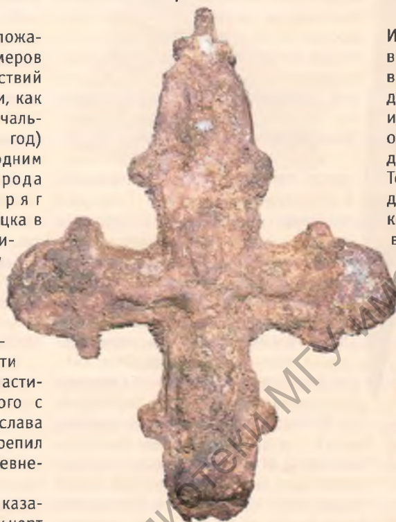
Находки из раскопок в Полоцке 2009 г. Энколпионы.

Под 862 годом в Лаврентьевской летописи встречаем сообщение о раздаче новгородским князем Рюриком 1 городов своим вассалам: «... и придоша старейшии Рюрику седи Новгороде а другии Синедоусь на Белоозере а третии Изборьсте Труворь ... и прия власть Рюрикь и раздаю мужемь своимь грады овому