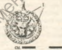
Рис. 3. Монетовидная привеска с изображением "турицы" 1 – изображение семи девушек

По средневековым письменным источникам также известно, что в обряде-игре "турицы" обязательное участие принимала группа из семи девушек. Главной фигурой был "тур" (парень в маске быка), от рогов которого должны были уворачиваться девушки [12, с. 665–666]. По мнению Б.А. Рыбакова радимичские монетовидные подвески с изображением бычьей головы как раз отражают этот языческий праздник (рис. 3).