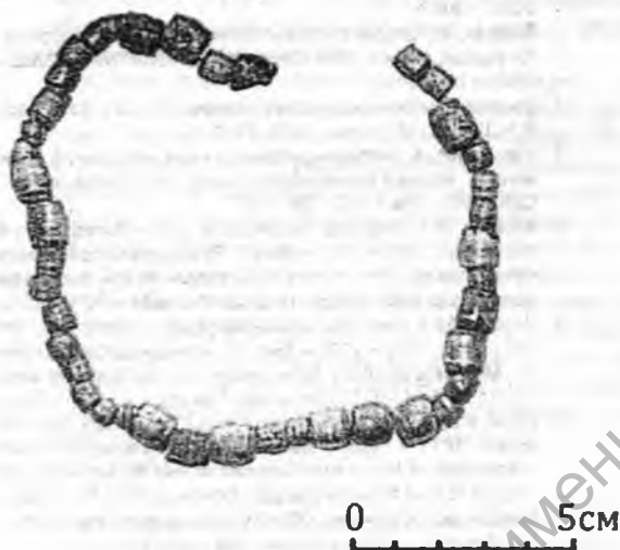
Рис. 2. Краеведческий музей г. Климовичи. Ожерелье из бусин

Ранее некрополь д. Старый Дедин имел широкие датированные границы – X – XIII вв. Благодаря новым материалам рамки формирования памятника могут быть сужены до конца X – начала XII в.