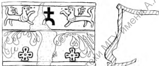
Мал. 3. Рэканструкцыя гзымсавай кафлі з расліннымі матывамі.

Невялікая колькасць гістарычных звестак пра дзейнасць гэтай асобы дазваляе толькі прыблізна акрэсліць час стварэння серыі кафлі з гербам «Селява». Зроблена яна была дзесьці напрыканцы XVII стагоддзя, а ў адзін набор з пячонкай кафляй з выявай букета ў вазе (першая палова – сярэдзіна XVII стагоддзя) магла трапіць пасля перабудовы печы.