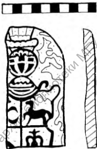
Мал. 2. Пячняя кафля з выявай герба Друцкіх-Сакалінскіх.

Па вызначэнню Н.Здановіч, кафля з выявай герба «Леліва» была выраблена ў самым пачатку XVII стагоддзя, не пазней 20-х гадоў [18]. Знойдзена яна падчас раскопу на вул.