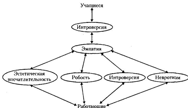
Рис. 2. Взаимосвязь эмпатии с личностными особенностями медицинских сестер

Корреляционный анализ полученных данных позволил установить взаимосвязь эмпатии и личностными особенностями медицинских работников. Эмпатия у работающих медицинских сестер имеет взаимосвязь с невротизмом ( r=0,41 ; p \leq 0,01 ), робостью ( r=0,44 ; p \leq 0,01 ), эстетической впечатлительностью ( r=0,39 ; p \leq 0,01 ), интроверсией ( r=0,37 ; p \leq 0,05 ). У опрошенных учащихся этот показатель взаимосвязан только с интроверсией ( r=-0,32 ; p \leq 0,05 ) (рис. 2).