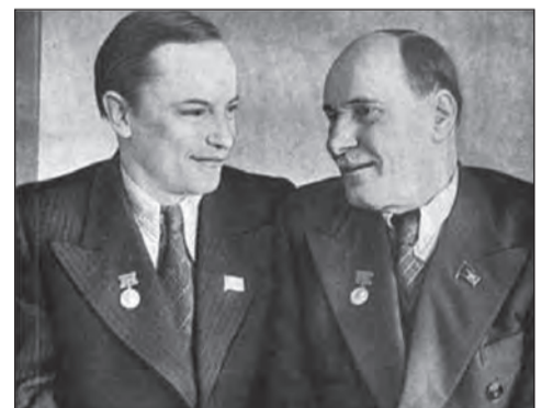
А. Куляшоў і Я. Колас