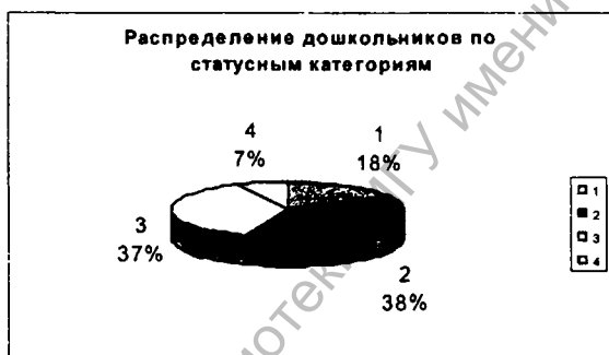
Рис. 1. Условные статусные категории: 1 – "непринятые"; 2 – "принятые"; 3 – "предпочитаемые"; 4 – "звезды"

На первом этапе исследовались межличностные взаимоотношения детей старшего дошкольного возраста с целью определения их положения в системе межличностных отношений. Был использован метод социометрии (методика "Капитан корабля") [3, с. 13]. Названная методика позволила определить социометрический статус испытуемых, необходимый для изучения его соотношения с волевым развитием детей и соотнести их с определенными статусными категориями. Результаты диагностики межличностных отношений дошкольников представлены на диаграмме (рисунок 1).