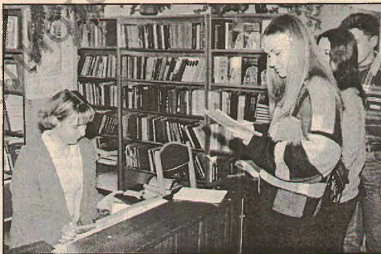
В читальном зале

Специфика педагогической практики на нашем факультете заключается прежде всего в том, что студенты уже с 1-го курса выполняют несложные исследовательские задания (определяют мотивацию учения детей, взаимоотношения в классе). На последующих курсах учебно-исследовательская работа студентов в школе усложняется. Полученные результаты обязательно используются при написании курсовых и дипломных работ. Мы стараемся приблизить тематику курсовых и дипломных к научно-исследовательской деятельности самих преподавателей. Приятно от-