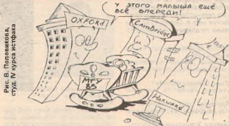
Рис. В. Половникова, студ. IV курса истфака