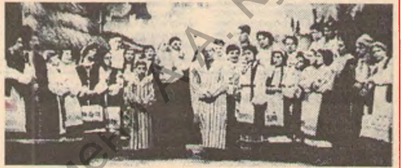
Опера "Запорожец за Дунаем" в постановке студентов 1939 г.

1941 г. В первые дни войны более 300 студентов и преподавателей института уходят добровольцами в действующую Красную Армию, остальные активно участвуют в героической обороне города, а позже работают в глубоком подполье, в партизанских отрядах, создают боевые группы. Трое воспитанников стали Героями Совет-