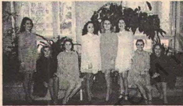
Вокальный ансамбль «Гармония» — лауреат Республиканских фестивалей.

Не хочется заканчивать пессимистически. В последние годы стабилизировался состав студентов, улучшились наборы на музыкальные специальности. На факультет приходят молодые люди с хорошей музыкаль-