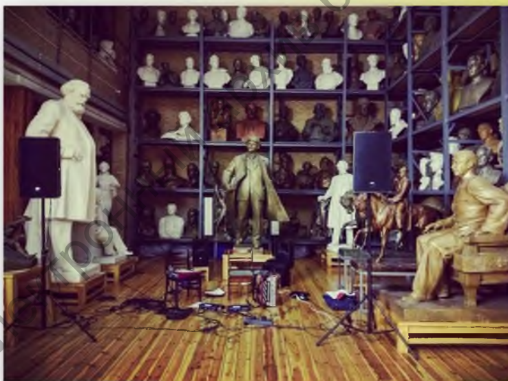
Музей скульптора Азгура