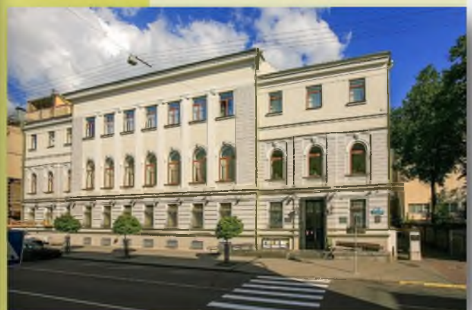
Национальный исторический музей