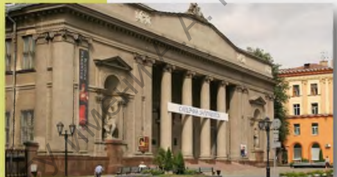
Национальный художественный музей