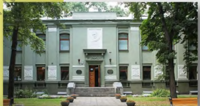
Музей Янки Купалы