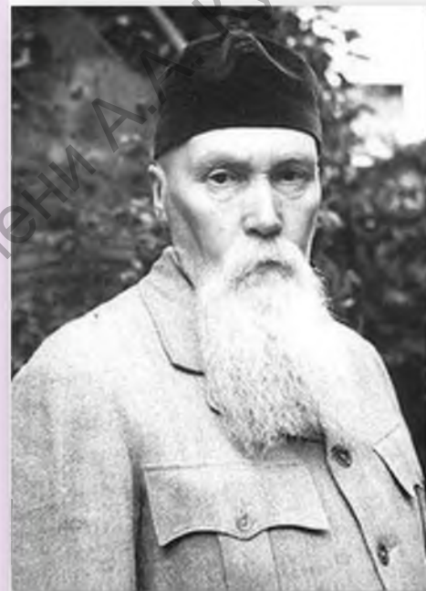
Идейный вдохновитель праздника Николай Рерих