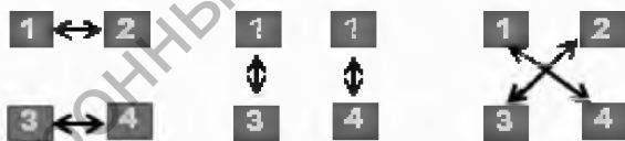
Рисунок 1 – Алгоритм работы в динамичной паре

В динамичной паре хорошо проводить работу с крупным текстовым материалом. Для этого текст параграфа, рассказа делится на смысловые части. Каждый учащийся читает, выбирает главное и запоминает материал только своей части. А потом рассказывает его соседям 2, 3, 4. А те в свою очередь рассказывают ему свой материал. После такого взаимодействия проводится презентация работы группы, выполняются тесты и т.д. (рис. 1).