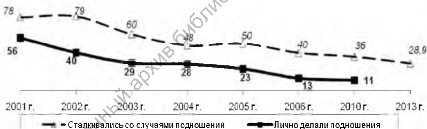
Рис. 2. Процентные доли студентов дневной и заочной формы обучения, сталкивавшихся со случаями подношений и лично даривших «подарки» преподавателям в период сессий в связи со сдачей экзаменов и зачетов

В приведенном ниже материале использованы результаты опросов, осуществленных Могилёвским институтом региональных социально-политических исследований (МИРСПИ) и кафедрой гуманитарных дисциплин Могилевского государственного университета продовольствия. Мы задавали в течение многих лет студентам старших курсов всех вузов Могилёвщины следующий вопрос: «Сталкивались ли Вы со случаями дарения преподавателям подарков в связи с экзаменами или зачётами?». Опросы проводились МИРСПИ в вузах как государственной, так и негосударственной формы собственности, начиная с 2001 по 2013 год. Все полученные ответы на этот вопрос представлены на рисунке 2. Для полноты картины мы поместили на одном рисунке два графика. Один отражает относительно индифферентный показатель «сталкивались со случаями дарения...», а второй фиксирует практику мздоимства в вузах в более жёсткой персональной формулировке «приходилось лично дарить подарки преподавателям в период сессии в связи со сдачей экзаменов и зачётов».