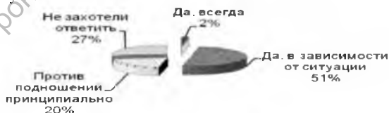
Рис. 3. Процентное распределение ответов студентов всех вузов на вопрос «Считаете ли Вы возможным делать подношения преподавателям в сессии?»

Однако вряд ли можно расценивать выявленную нами тенденцию очищения вузовского образования как повод для самоуспокоения. Понятно, что полученные даже в ходе анонимного опроса данные приходится расценивать как минимальный уровень действительного мздоимства в высших учебных заведениях. Дело в том, что студенческое мнение приходится считать не совсем адекватным при оценке уровня коррупции в вузах. Скорее, оно является «кривым зеркалом», не совсем верно отображающим практику подношений преподавателям во время экзаменов и зачётов. Причиной такого искажения выступает личная заинтересованность не только некоторых мздолюбивых преподавателей, но и значительной части учащихся в коррупционном варианте процедуры приёма экзаменов и зачётов. Важным фактором, во многом определяющим коррупционную атмосферу в системе образования, является моральная готовность учащихся к «подмазыванию» преподавателей подарками, дабы те смягчили свои требования к ним в период сдачи зачётов и экзаменов. Уровень такой готовности можно измерить с помощью следующего вопроса-индикатора: «Считаете ли Вы возможным делать подношения преподавателям в период сессии?». Мы задавали этот вопрос на протяжении как минимум десяти лет старшекурсникам всех вузов Могилёвской области как очной, так и заочной формы обучения. Полученное в ходе этих опросов распределение ответов визуально представлено на рисунке 3.