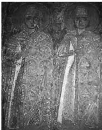
Рис. 12. Фреска с изображениями св. Бориса и Глеба из полоцкой Спасо-Преображенской церкви XII в.