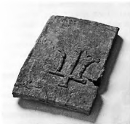
Рис. 9. Изображение трезубца на плинфе полоцкого храма Архангела Михаила XII в. Раскопки М. К. Каргера.

Так, на постелистой стороне плинфы полоцкой церкви Рождества Христова XII в. (в историографии еще известной как «Церковь на рву») присутствуют княжеские трезубцы, во многом напоминающие изображения на печати (с перекрестьем) из Полоцка (рис. 8) 16 . Аналогичное изображение представлено на плинфе «княжеского храма» Архангела Михаила на Верхнем замке Полоцка (раскопки М. К. Каргера) (рис. 9) 17 . Считается, что данные клейма — знаки князей — заказчиков