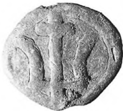
Рис. 4. Печать XI–XII вв. с изображением трезубца. Находится в частной коллекции.

не оба изделия практически идентичны, разница заключается в общих размерах, а также в наличии дополнительного изгиба в одном из двузубцев на обороте.