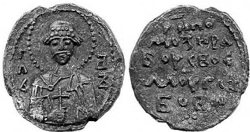
Рис. 10. Печать менского князя Глеба Всеславича (1101–1119 гг.) с изображением св. Глеба на лицевой стороне. Найдена в Острожском районе Ровенской области (Украина).

Небесным заступником Глеба Всеславича Менского также являлся один из братьев-страстотерпцев, примером этого является печать, найденная в 1995 г. в Острожском районе Ровенской области (Украина) (рис. 10). На ней представлено погрудное изображение святого Глеба. На обратной стороне помещена надпись: «Господи помози рабу своему Глебови» 22 . Подобные единичные изображения святых встречаются в произведениях декоративного искусства в других регионах Руси.