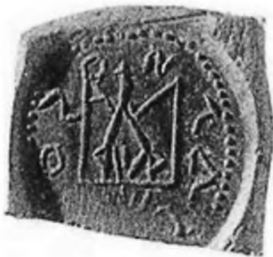
Рис. 5. Печать с надписью «ИЗОС(Л)АВ)ОС» и изображением трезубца, найдена в Новгороде.