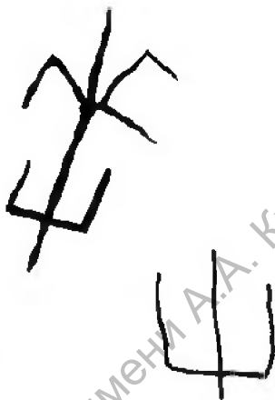
Рис. 6. Византийская амфора (конец X — начало XI в.) с изображением трезубцев, найдена в Полоцке. Раскопки А. Л. Коца.

Ярослава с кругом на зубце. Остальные атрибуты княжеских знаков Рюриковичей, по мнению исследователя, остаются пока лишь неверифицируемыми догадками 13 .