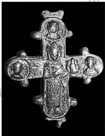
Рис. 11. Оборотная сторона креста-энколпиона с изображением св. Глеба, найдена в Полоцке. Раскопки Д. В. Дука.

Таким образом, старейшинство и принцип мирного сосуществования между князьями-братьями после смерти князя-отца были во-