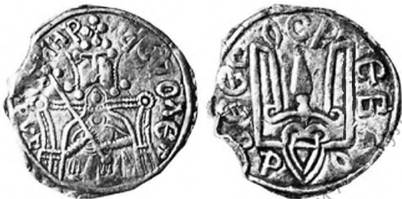
Рис. 3. Серебряник Владимира Святославича (тип III) с изображением трезубца на реверсе.