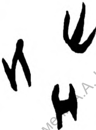
Рис. 7. Византийская амфора (конец X — начало XI в.) с изображением буквенных знаков и трезубца, найдена в Полоцке. Раскопки А. Л. Коца.

Амфоры использовались для перевозки и хранения дорогих и социально престижных товаров — вина, масла, пряностей. Массово на Русь амфоры поступают с XII в., во второй половине X — XI в. подобные изделия в раннегородских и торгово-ремесленных центрах были достаточно дорогим и престижным товаром. Потребителями этих товаров и владельцами амфор были люди высокого социального статуса. Княжеские знаки в виде трезубцев на амфоре из Полоцка свидетельствуют о принадлежности товара, перевозимого в ней, полоцкому княжескому двору. Заказчиком товара в данном случае мог быть представитель княжеской администрации, не исключено, что наместник Владимира Святославича (в том числе и обладатель вышеупомянутой подвески). Возможно также, что знак трезубца с усложненным перекрестием центрального зубца мог принадлежать Изяславу Владимировичу.