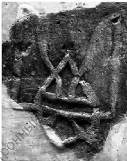
Рис. 2. Плинфа Десятинной церкви (конец X в.) с изображением княжеского знака (трезубца) Владимира Святославича.

Трезубцы на подвесках берут свое начало от княжеского знака Владимира, одно из ранних изображений которого представлено на