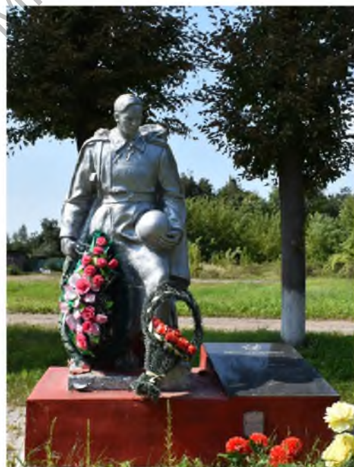
Рис. 2. Братская могила № 3232. Фото автора, 2018 г.

Следует отметить, что на территории Могилевского р-на (без учёта г. Могилева. – А. К.) на момент 2017 г. зафиксировано 116 воинских захоронений общим количеством захороненных 28 420 человек, из них братских могил (далее – БМ) – 74 (28 378 человек) и индивидуальных могил (далее – ИМ) – 42 [4].