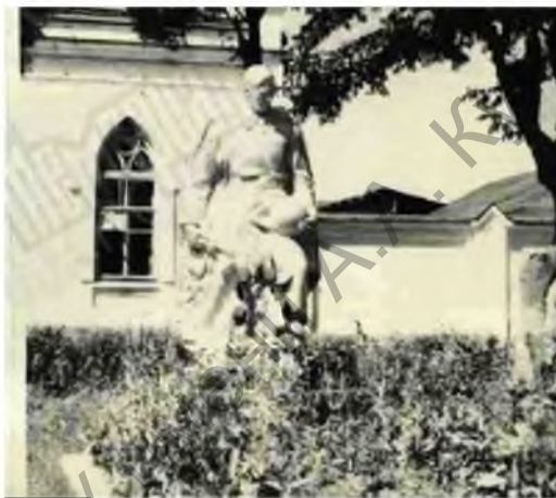
Рис. 1. Братская могила № 3232. Фото из учетной карточки, 1991 г.

В данной статье на примере братской могилы № 3232 в д. Новоселки Могилевского р-на рассмотрим процесс верификации данных погибших и захороненных воинов Красной армии в основном при освобождении данной территории в 1944 г.