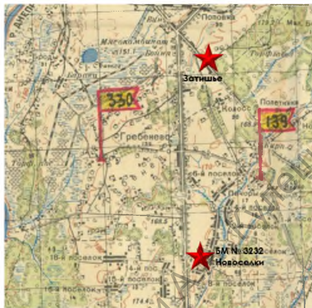
Рис. 4. Карта с нанесением первичного места захоронения воинов 1109 сп 330 сд. Составлена автором

Таким образом, при верификации данных БМ № 3232 можно сказать о том, что исследование воинских захоронений имеет место быть. Выявить (при условии соответствия официальных данных по количеству захороненных реальной картине) довольно сложно без верификации воинских захоронений не только Могилевского р-на, но и пограничного с ним Быховского р-на.