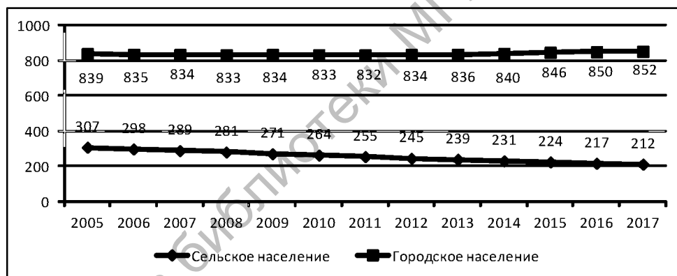
Рисунок 1 – Численность городского и сельского населения Могилевской области на начало года, тыс. человек

Молодежь города или села является основным источником социального потенциала, в том числе трудового. Демографическая ситуация городских и сельских поселений неодинакова, на примере Могилевской области можно видеть, что в городах она относительно стабильна, а в сельской местности идет устойчивое сокращение сельчан (рисунок 1) [2].