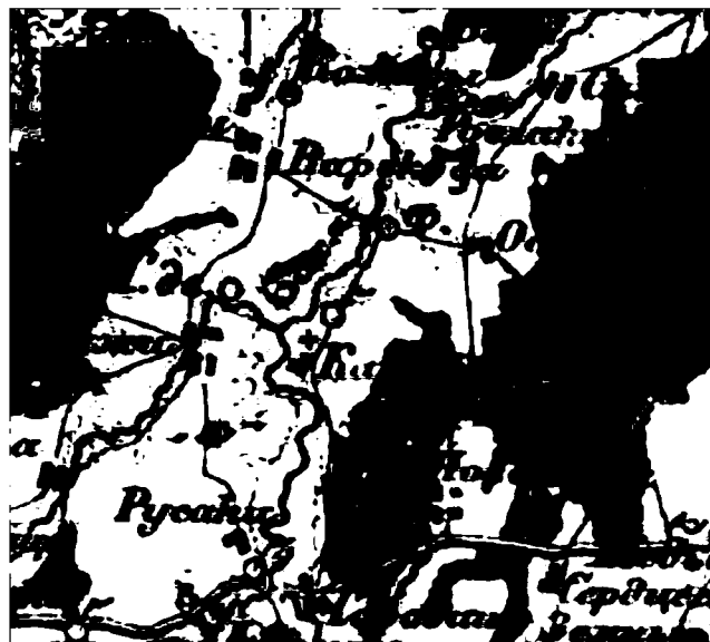
Рис. 2. Фрагмент карты И. А. Стрельбицкого