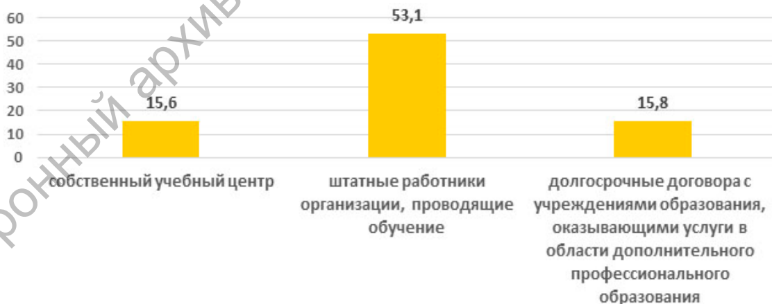
Рисунок 2 – Распределение мнений респондентов о наличии условий и базы для организации внутрифирменного обучения, %

Для респондентов значимым представляется условие наличия договоров с центрами и организациями, предоставляющими услуги дополнительного профессионального образования. Незначимыми оказались условия, связанные с формальными и неформальными отношениями по поводу организации обучения с учреждениями профессионального, специального и высшего