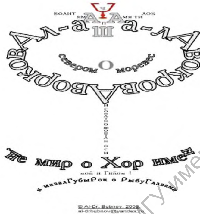
А. Бубнаў. “Посвящение Гийому (визуопалиндромный перевод каллиграмм)”

Як прыклад моўнай гульні можна разгледзець амбіграмы, што ўяўляюць каліграфічны ўзор, які дазваляе сумяшціць два розныя прачытання з аднаго і таго ж набору ліній (пры павароце, адлюстраванні, пільным узіранні і г. д.). Напрыклад, амбіграма магілёўскага паэта Д. Дзмітрыева: