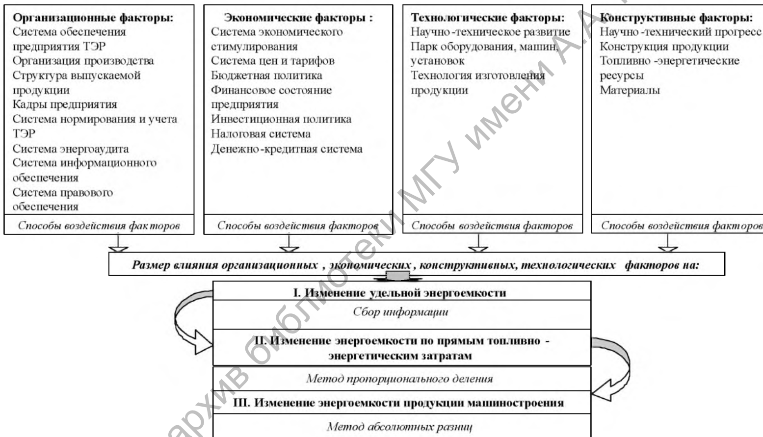
Рисунок 2. Порядок расчета влияния организационно-экономических факторов на энергоемкость продукции