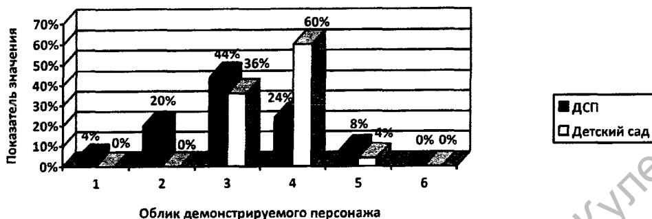
Рисунок 2 – Результаты исследования представлений дошкольников об образе «Я – привлекательное»