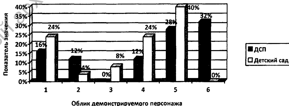
Рисунок 3 – Результаты исследования представлений дошкольников об образе «Я – непривлекательное»

Таким образом, дети дошкольного возраста, воспитывающиеся в учреждениях интернатного типа, по ряду существенных психологических характеристик отличаются от детей, воспитывающихся в семье. Дети из социального приюта реже, чем их сверстники из семьи, способны полностью идентифицировать себя с персонажем соответствующего пола и возраста. Воспитанники интернатного учреждения более позитивно относятся к прошлым половозрастным ролям, в то время как дошкольникам из семьи присуще