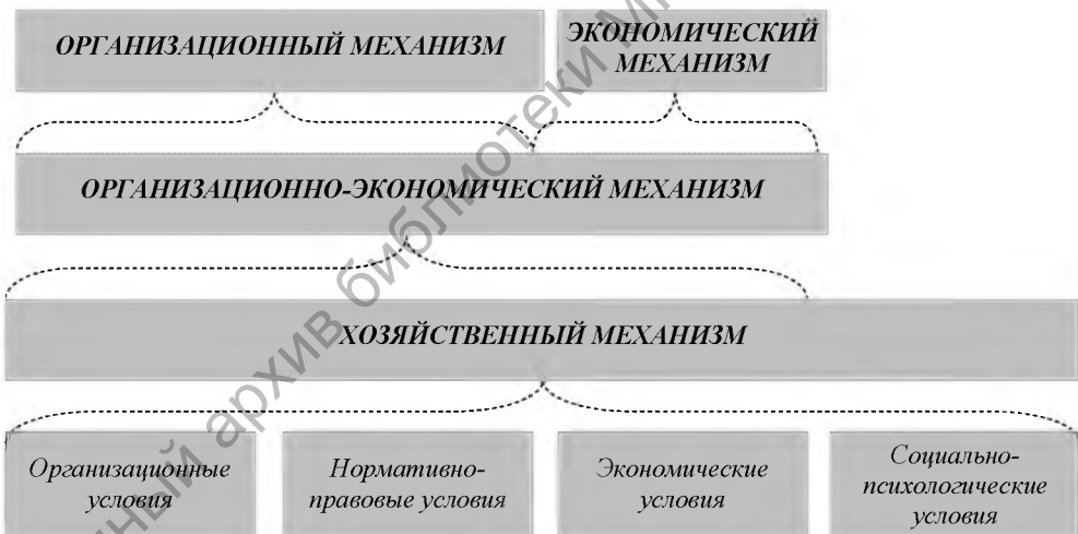
Рис. 2. Системно-иерархическая структура хозяйственного механизма

Зная структурные составляющие хозяйственного, организационно-экономического, экономического и организационного механизмов можно построить их условную структурную модель. Мы предлагаем использовать системный подход при построении данной модели. Целесообразность данного шага заключается в том, что хозяйственный механизм и структурные подмеханизмы (организационно-экономический, экономический, организационный) представляют собой единую систему, в которой они преемственно взаимосвязаны, каждый из них является подсистемой и находится на соответствующей ступени иерархии (см. рис. 2).