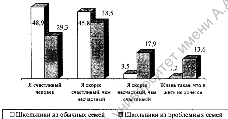
Рис. 1. Распределение ответов на вопрос: "Как Вы оцениваете свою жизнь?", %

Среди социальных условий, влияющих на самоубийства, важную роль играют некоторые культурные явления. В подростковом возрасте особую опасность представляет такая форма суицида, в которой присутствует момент подражательности. Самоубийства кумиров, актеров, музыкантов распространяют суицидальные настроения и могут вызвать волну ответных самоубийств у подростков. При этом многие физиологические изменения в этом возрасте делают психику подростков очень восприимчивой и ранимой. Поэтому близкие, доверительные отношения с родителями в этот жизненный период ребенку просто необходимы. В этой связи приведем данные о том, как респонденты оценивают свою жизнь (рис. 1).