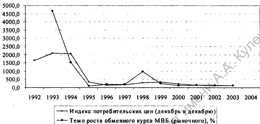
Рис. 1. Инфляция (по ИПЦ, декабрь к декабрю) и девальвация (на конец года) в Республике Беларусь в 1992 – 2003 гг.

Экспансионистская монетарная политика привела к раскручиванию инфляционно-девальвационной спирали. В результате инфляция в Республике Беларусь по индексу потребительских цен (ИПЦ) выросла за 1993 и 1994 гг. в 21 раз, девальвация официального валютного курса соответственно в 47 и 15 раз (рис. 1). Валютный курс формировался на основе спроса и предложения, в стране сложилась система плавающих валютных курсов.