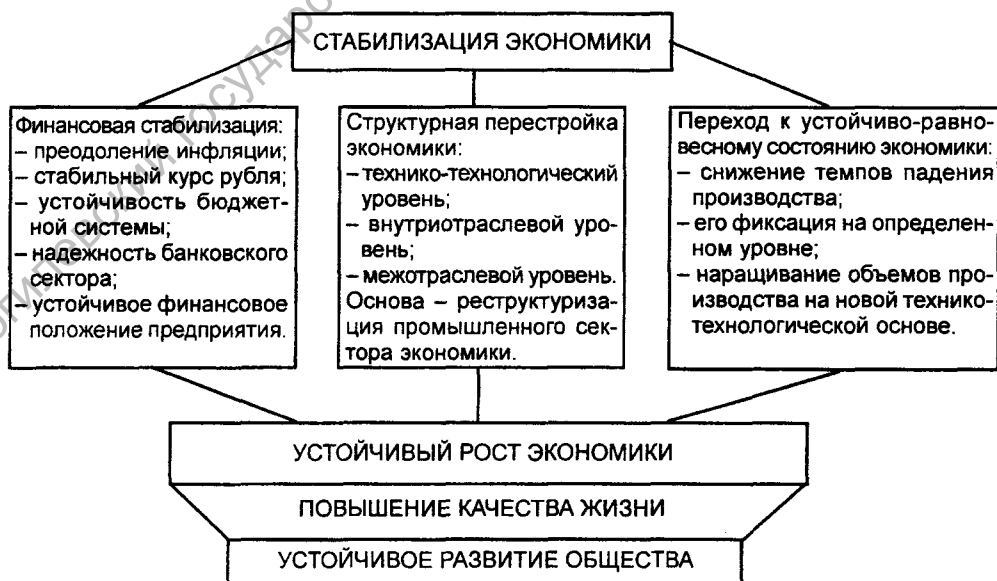
Рис. 1. Диалектика процесса перехода экономики к устойчивому развитию

С учетом изложенного, процесс преодоления кризиса экономики и ее перехода к устойчивому развитию логически может быть выражен в виде следующей последовательности: структурная перестройка экономики – ее стабилизация – устойчивый рост на качественно новой технико-технологической основе – устойчивое развитие общества в целом (рис. 1).