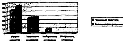
Рис. 1. Типы эмоционального отношения приемных и биологических матерей к родным детям.

Сравнительный анализ эмоционального отношения приемных и биологических матерей к родным детям представлен на рисунке 1.