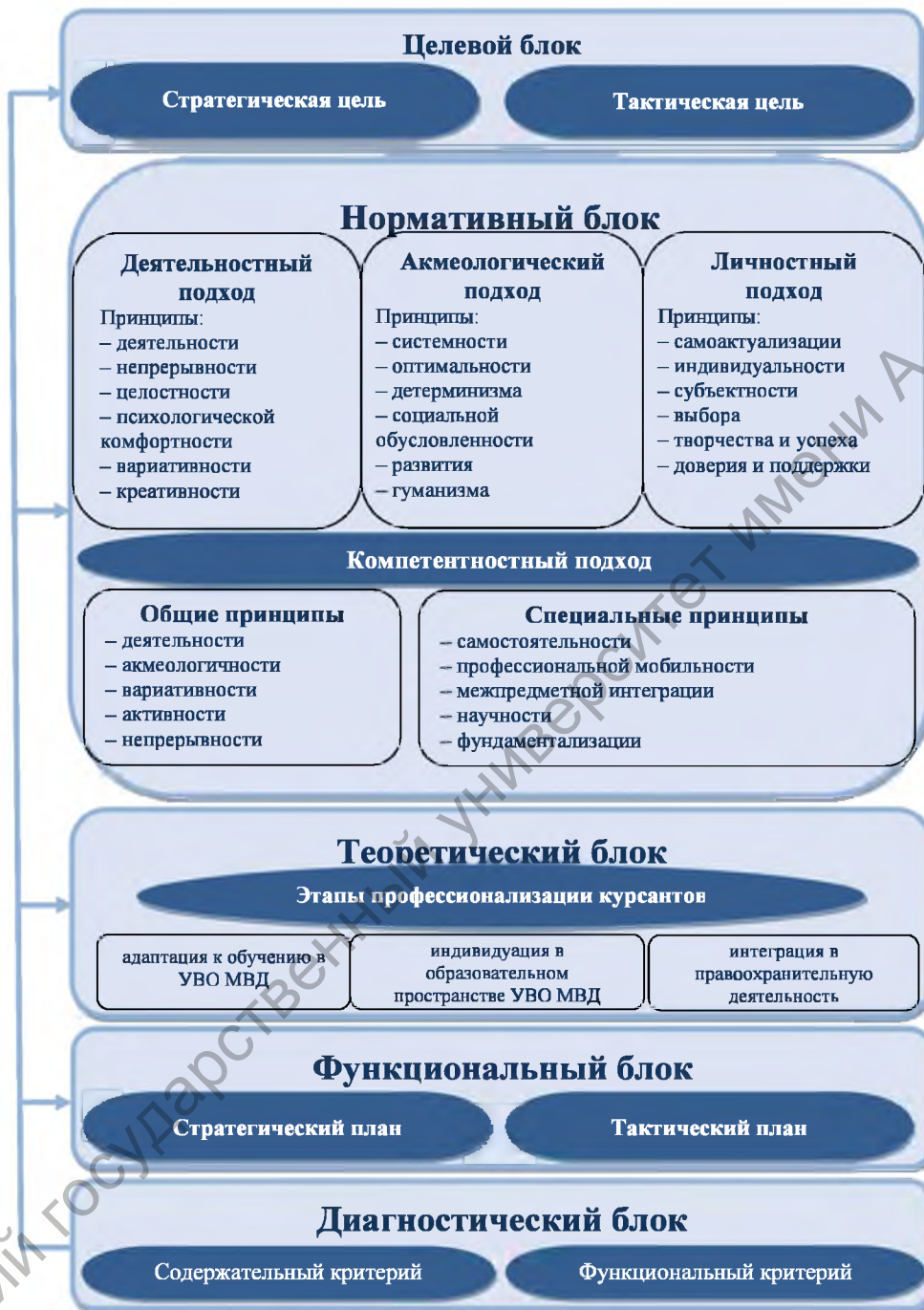
Рис. 2. Модель развития академической компетентности курсантов