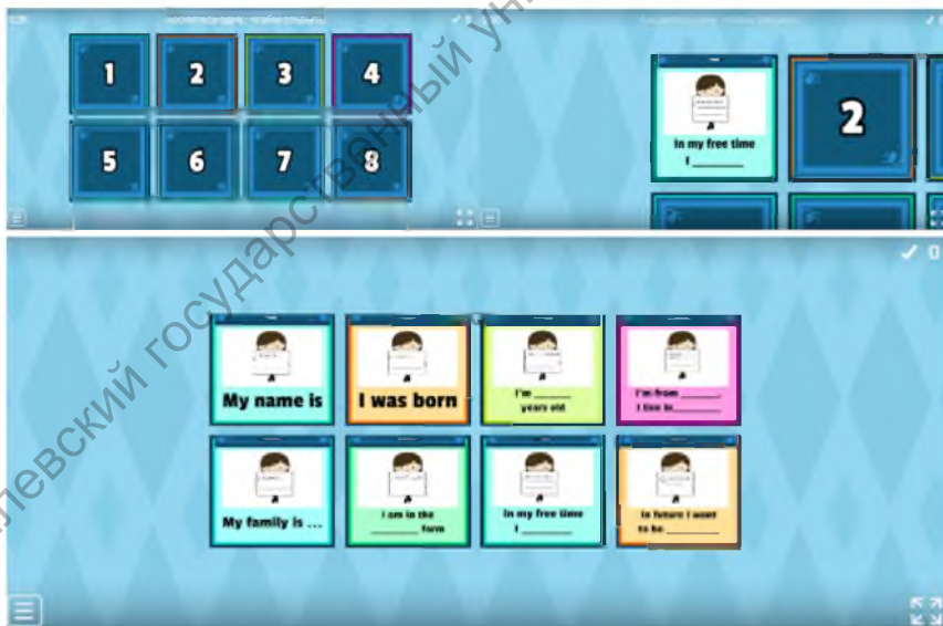
Рис. 1. Группа сюжетных картинок по теме «About myself»

Для создания интерактивных заданий использовался шаблон «Откройте поле». Данный шаблон позволяет последовательно открывать серию картинок. Первая серия картинок представлена на рисунке 1.