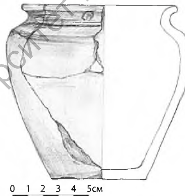
Рис. 2. Развал гончарного горшка. Досова Селиба, курган № 64

Лепные фрагменты стенок характеризуются толстостенностью, в тесте крупные примеси жерствы. Несколько единиц имеют следы нагара.