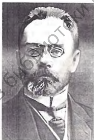
Лідэр партыі "Союз 17 октября" А.І.Гучоў, адзін з кандыдатаў у кіраўнікі "міністраства даверу".