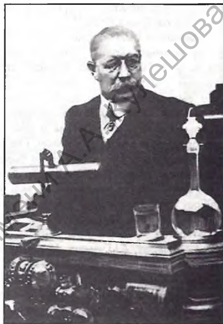
Дэпутат Дзяржаўнай думы, лідэр фракцыі кадэтаў П. М. Мілюкоў выступае з прамовай. 1915 г.