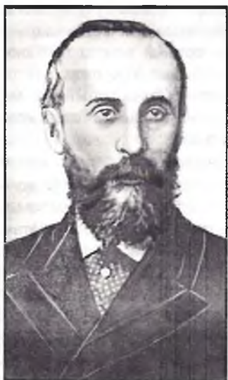
Дэпутат Дзяржаўнай думы, лідэр фракцыі прагрэсіўных нацыяналістаў У.А.Бобрынскі.