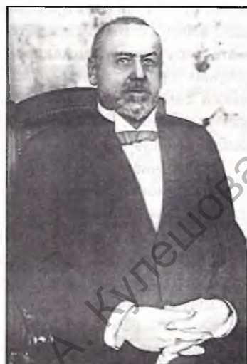
Старшыня IV Дзяржаўнай думы акцябрыст М.У.Радзянка.