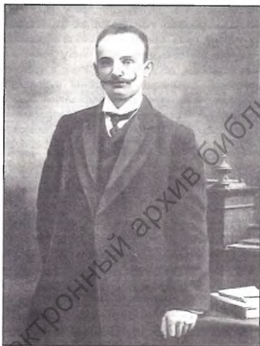
Дэпутат Дзяржаўнай думы, лідэр фракцыі прагрэсіўных нацыяналістаў В. В. Шульгін.