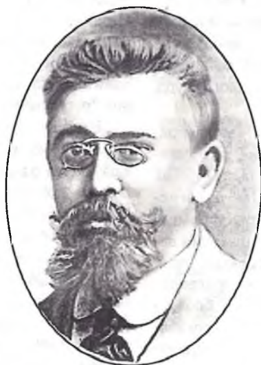
Дэпутат Дзяржаўнай думы, лідэр фракцыі прагрэсістаў І.М.Яфрэмаў.