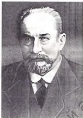
Старшыня Часовага ўрада князь Г.Я.Львоў.