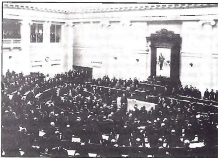
Пасяджэнне IV Дзяржаўнай думы ў Таўры́часкім палацы.