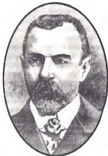
Дэпутат Дзяржаўнай думы акцябрыст С.І.Шыдлоўскі, афіцыйны лідэр Прагрэсіўнага блока.