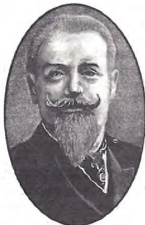
Старшыня Савета міністраў Б.У.Шцюрмер.