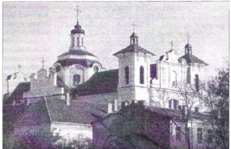
Да 1686 г. Святадухаўскі манастыр у Вільні быў падпарадкаваны канстантынопальскаму патрыярху.

Праваслаўныя русіны з беларускіх земляў бралі актыўны ўдзел у выведных мерапрыемствах супраць Маскоўскае дзяржавы, складалі касцяк тых «шпегай» і «рыскуноў», якія, рызыкуючы сваім жыццём, здабывалі каштоўную інфармацыю, захоплівалі маскоўскіх «языкоў» 43 . Гэта былі розныя людзі, але не апошняе месца сярод іх займалі беларускія месцічы. Сабраная праваслаўным барысаўчанінам Фёдарам Якімовічам інфармацыя пра маскоўскае войска істотным