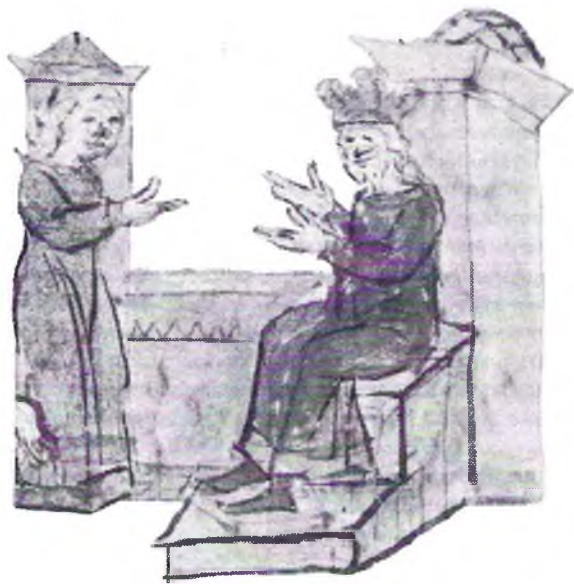
Уяспяў Чарадзеяў як кіеўскі князь — мініятура з Радзівілаўскага летапісу. Насуперак сучаснаму разуменню Полацка, як кальскі беларускай дзяржаўнасці, такая ацэнка старажытнай дзяржавы на Дзвіне зусім неўласціва грамадскай думцы Беларусі XIV—XVII стст.

Такім чынам, у гэтым летапісе адлюстраваныя погляды праваслаўнага русінскага наблітэту ВКЛ. Летапісы гэтага збору змяшчаюць у пачатковай частцы скарачаныя варыянты «Аповесці мінулых гадоў» і спісы ўсходнеславянскіх князёў, «Сказаніе о верных святых князех руських». Перад намі паўстае схема гісторыі Усходняй Еўропы, паводле якой першапачатнай формай ўласнай дзяржаўнасці русінаў ВКЛ выступае Кіеўская Русь. Традыцыі Кіева пераймае Вільня, і, адпаведна, ВКЛ трактуецца як легітымная пераемніца Кіеўскай Русі, як «свая» дзяржава. Паказальна, што ў летапісах I збору нічога не гаворыцца пра гісторыю ВКЛ ды пра заваёвы літоўскіх князёў на сучаснай тэрыторыі Паўднёва-Заходняй і Паўночна-Усходняй Беларусі. Адзіны вынятак — апісанне барацьбы за Смаленск, але і тут зацёмліваецца, што ў горадзе існавала шматлікая «літоўская» партыя 6 . Узнікненне гэтай канцэпцыі абумоўлена завяршэннем