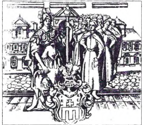
Заснаваная Пятром Магілай Кіева-Магілянская акадэмія ў XVII ст. была агульнай «кнзуняй кадраў», з якой выходзілі асветаныя прадстаўнікі беларускай і украінскай праваслаўнай эліты.

Сярод легендарных нашчадкаў прабацькі славянскіх народаў « Мосаха, сына Яфетава і ўнука Ноева » на першае месца паводле старшынства ён ставіць Руса, а ўжо потым Леа і Чэха, ад якіх паходзяць « усе Русацы, Палякі, Масква, Балгары, Чэхі » ды іншыя славянскія народы. «Свая» гісторыя для І. Яўлевіча — гэта найперш гісторыя Кіеўскай Русі. Першыя « рускія князі » — Кій, Шчэк і Харыў. Пасля адбываецца запрашэнне варагаў — і ад Рурыка, Сінебуса і Трувара паходзяць усё « рускія » і « маскоўскія » князі. Уладзімір Святаслававіч, « кнаш » князь, хрысціў « нашу » Русь 56 .