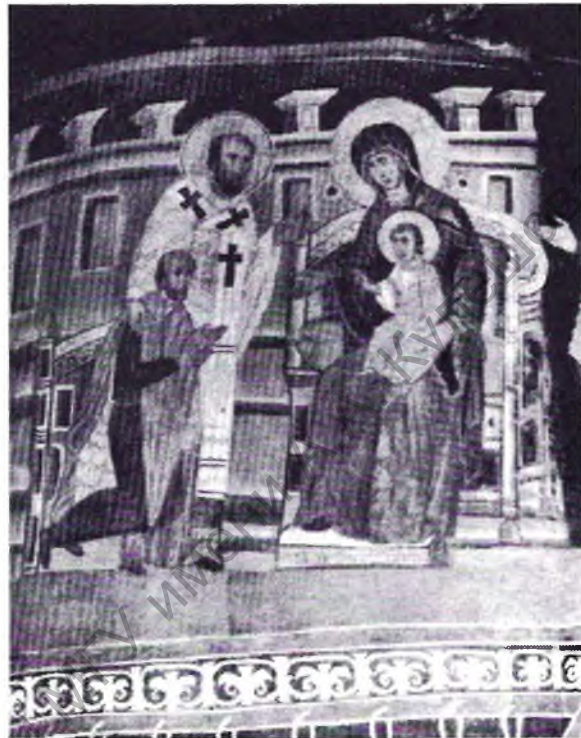
Сцэна фундаментальная з Уладыславам Ягайлам з капліцы святой Тройцы на замку ў Любліне (1415) сведчыць пра ўплыў высокай русінскай (беларуска-ўкраінскай) культуры на польскую таго часу.

Ні ў аднаго з летапісаў не выклікала сумневу, што легітымнымі ўладальнікамі гэтых земляў «ад старыны» з'яўляліся менавіта «Кіеўскія манархі», і толькі нашэсце Батыя