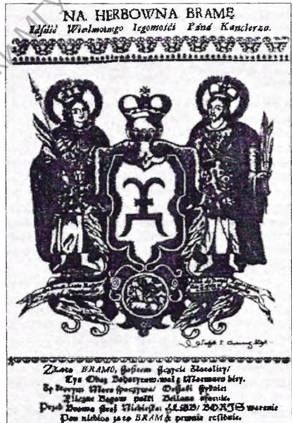
Герб роду Агінскіх. Прэтэндуючы на права лічыцца адзінымі легітымнымі лідэрамі «народу рускага», Агінскія скарыстоўвалі для гэтага генеалагічную легенду аб паходжанні ад Барыса і Іліба.

Вядома шмат прыкладаў, калі праваслаўнае брацкае духавенства, праваслаўная шляхта ратаваліся ўцёкамі ад войскаў Аляксея Міхайлавіча. Вельмі цікавая крыніца — тэстамент 1662 г. Якава Палікарповіча, аршанскага праваслаўнага пратапопа. Гэты дакумент хутчэй нагадвае мінідыярыуш ды заслугоўвае асобнай публікацыі 66 . Зараз звернемся толькі да ўспамінаў святара аб ваенным ліхалецці. Набліжэнне да Оршы маскоўскіх ратнікаў у Якава Палікарповіча захаплення не выклікала: «[...] уносячы здаровье свое от рук неприятельских московских запровадилем был всю убогую маетность в Старый Быхов». У абложанай фартэцыі аршанскі пратапоп перахоўваў не толькі ўласную маёмасць, але і ўратаваныя ім з аршанскай брацкай царквы каштоўнасці, кнігі і архіў. Пасля захопу Быхова ўсё гэта было разрабавана: «[...] за взятем тогож Старого Быхова през неприятелей московских тоуж моее розное маетности на золотых пятнадцат тысяч взяли [...] и аппараменты церкви брацкое Оршанское. То ест ризки двое злочонные, евангелие среброное опракос, кадильница сребренная и келихов два серебряных [...] крест злоцистый с каме-