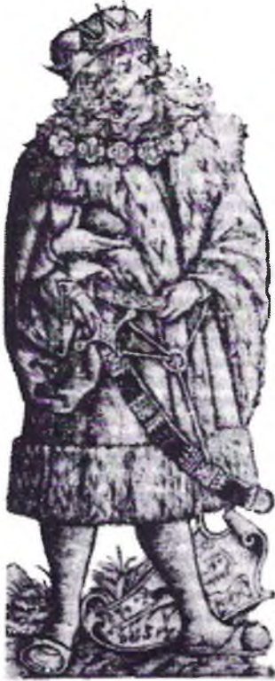
Паводле Яна Длугаша Лех — агульны продак палякаў і русінаў. Гравюра з «Трактату пра дзве Сарматы» М. Мяхоўскага.

працэсу фармавання ў сярэдзіне — другой палове XV ст. адзінага літоўска-русінскага «палітычнага народа» 7 .