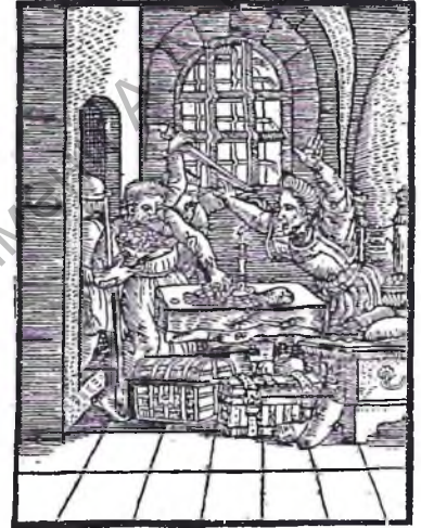
Нават рабунак, здаецца, уяўляўся традыцыйнай маралі Сярэднявечча меншым грахам, чым ліхварства.

цалого гроша, а некаторыя і большай, даюць ат копы на тыдзень (больш за 87% у год. — І.М.) за чымсьнове земские ку убоству приходять”. Разам з гэтым, хадайнічаючы аб збаснаванні банку, шляхта прасіла, каб пасля яго адкрыцця ніхто не наважваўся даваць грошы ў “ліхву”, бо не толькі купцы, пакінуўшы гандаль, займаюцца ліхварствам, але і некаторыя з стану рыцэрскага, пакінуўшы гаспадарства прыстойнае, на ліффу пенязя даюць 5 .