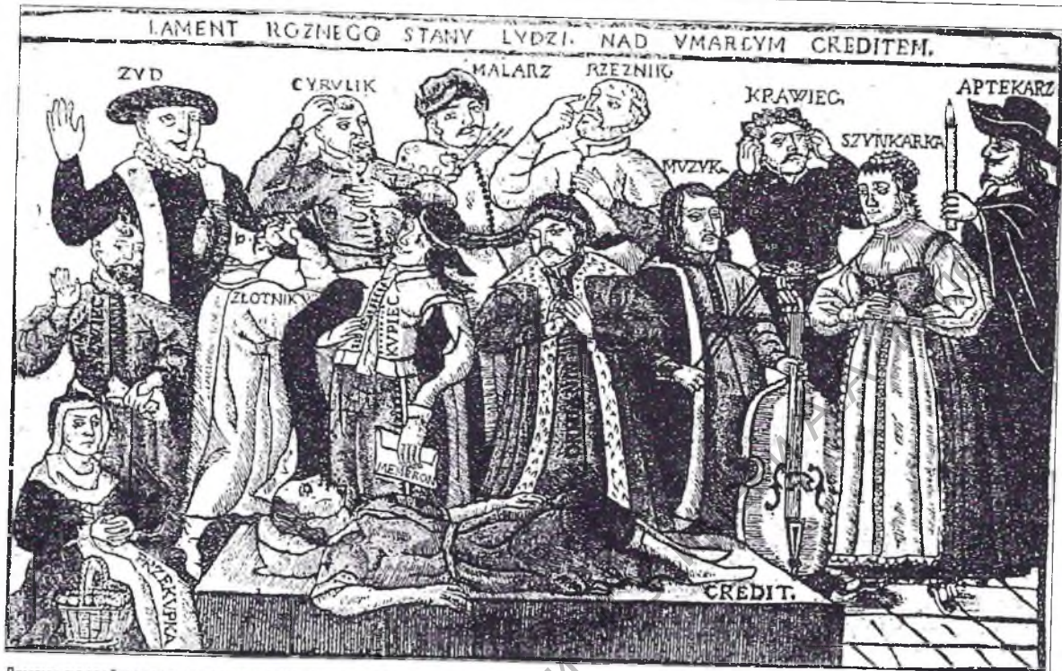
Лямант людзей рознага стану над памерлым крэдытам.

Сюжэт, адлюстраваны польскай карыкатурай XVII ст., быў вельмі папулярны ў тагачаснай Еўропе.