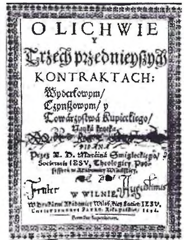
Вокладка трактату Марціна Сміглецкага “O lichwie...”.