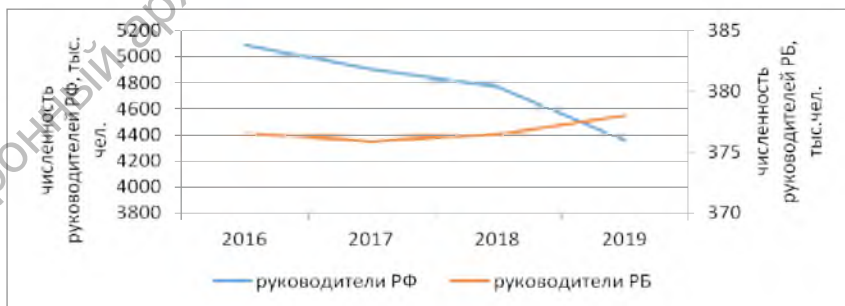
Рис. 1. Динамика численности руководителей в РБ и РФ за 2016 – 2019 годы

На рисунке 1 представлена динамика численности руководителей в Республике Беларусь и России. Как видно из рисунка 1, наблюдается незначительный рост емкости рынка труда менеджеров в РБ (средний темп прироста за исследуемый период составил 0,14%). Емкость рынка труда менеджеров в РБ можно считать стабильной. В то же время в РФ наблюдается снижение численности руководителей (средний темп прироста – 5%), что указывает на уменьшение емкости рынка менеджеров.