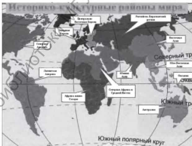
Рисунок 2 – Наиболее распро- страненный в сети Интернет вариант историко-культурно- го районирования мира.

По большому счету это даже не разночтения, а просто отсутствие договоренности между различными специалистами о содержании понятий (исторических, историко-культурных, географических, историко-географических, политико-географических, историко-политических, этнографических и т.д.). Приведем примеры, которые показывают как сложно порой понять, о чем в данном случае идет речь.