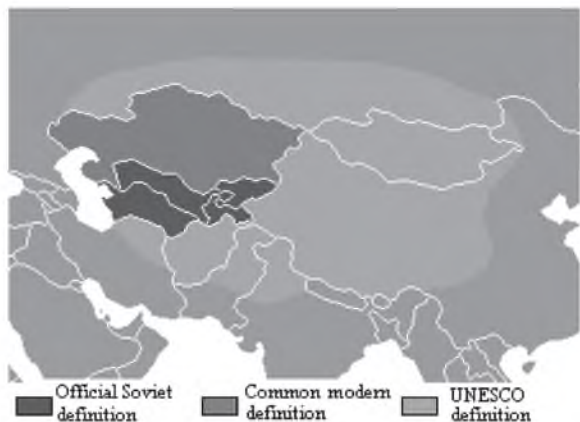
Рисунок 3 – Содержание понятия «Центральная Азия»

верную Индию и северный Пакистан, северо-восточный Иран, Афганистан, районы азиатской России южнее таёжной зоны и пять бывших советских республик Средней Азии. Существует еще как минимум несколько трактовок по составу региона.