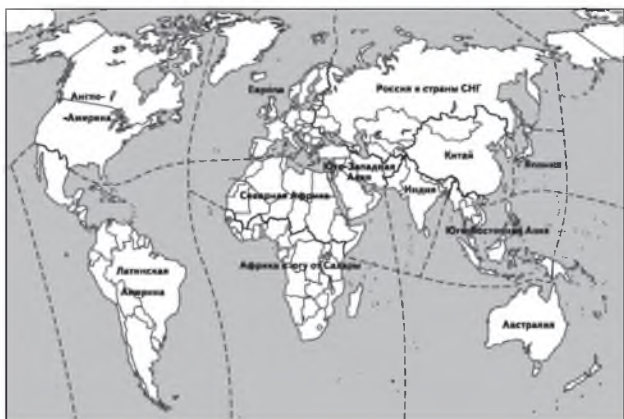
Рисунок 1 – Культурные регионы мира (из американского учебника «География мира»).

субкультурная область Тихого океана (Океания) и др. Выделяют и такие ИКО, как циркулярная область с рудиментарными этносами, Евразийские степи и др. Но в районировании Европы и остальной Азии разночтений остается еще много, хотя традиционно выделяются ИКО: Европейская (часто делят на Западную Европу и ЦВЕ); Индийская; Китайская (Восточно-Азиатская); Индокитайская (Юго-Восточная Азия) и т.д. (рис. 1, 2).