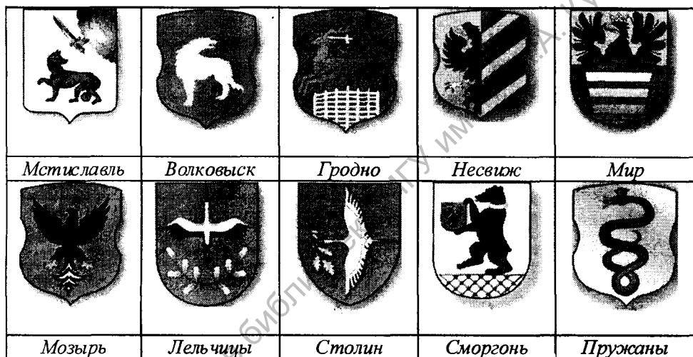
Рис. 1. Гербы городов (животные)

Объектами поклонения из числа животных всегда были медведь (герб Сморгони), волк (Волковыск, Логошин, Мстиславль; Логошинский волк с лосиными ногами, Мстиславский - с красной лисьей шерстью), рысь (Гомель, Белица), олень (Гродно; олень святого Губерта с крестом между рогами), орёл (Несвиж, Мозырь, Мир), уж (Пружаны) [23].