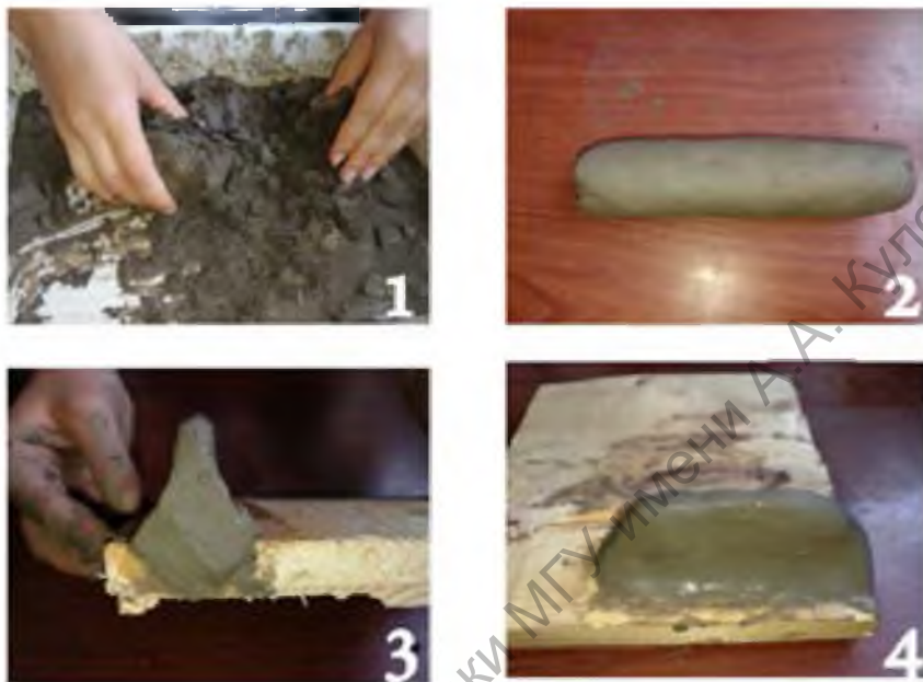
Рис. 2. Этапы формовки изразца-перемычки. 1 – подготовка глины; 2 – основа для создания изразца; 3-4 – формовка лицевой пластины и крепежного элемента с использованием деревянной матрицы.

Таким образом, изразцы-перемычки всех изученных коллекций с территории Могилевского Поднепровья имеют почти идентичные морфологические показатели и орнаментальный мотив. Изделия соотносятся хронологически с материалами второй половины XVII – начала XVIII в. Лицевая пластина и анкер перемычек ( J_1 ) изготавливались из одного куска глины. Угловые перемычки ( J_2 ) изготавливались из двух отформованных стандартных перемычек ( J_1 ). Для декора лицевой пластины использовали рельефный орнаментальный мотив и поливы двух цветов.