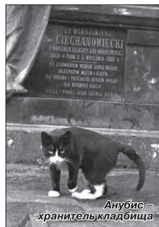
Анубис – хранитель кладбища

солнца осталось 30 минут. Давай руку, спустимся ближе к воде. Я весьма предусмотрительна, так что взяла с собой плед. Можешь прилечь и закрыть глаза. Закрывать? Да, свет закатного солнца уже укрыв твои веки. На этом я могу закончить свой рассказ.