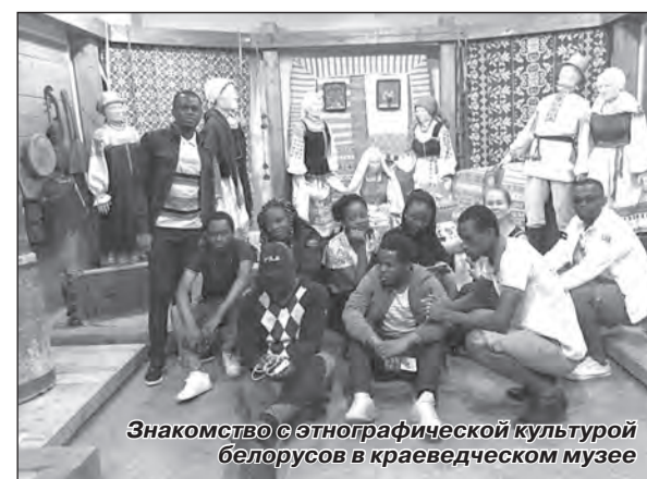
Знакомство с этнографической культурой белорусов в краеведческом музее