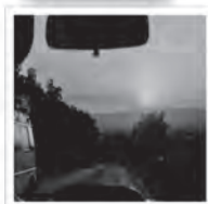
ВЕРНІСАЖ ПРАЦУЕ Ў ГАЛЕРЭІ БІБЛІЯТЭКІ УНІВЕРСІТЭТА 15 ВЕРАСНЯ - 31 КАСТРЫЧНІКА 2020 ГОДА