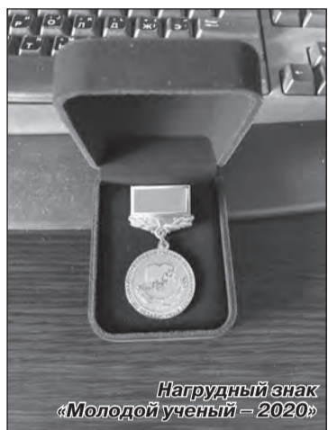
Нагрудный знак «Молодой учёный – 2020»

На вопрос «Почему факультет математики и естествознания в МГУ