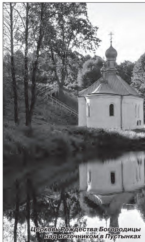
ЧЕРКОВЬ РОЖДЕСТВА БОГОРОДИЦЫ НАД ИСТОЧНИКОМ В ПУСТЫНКАХ