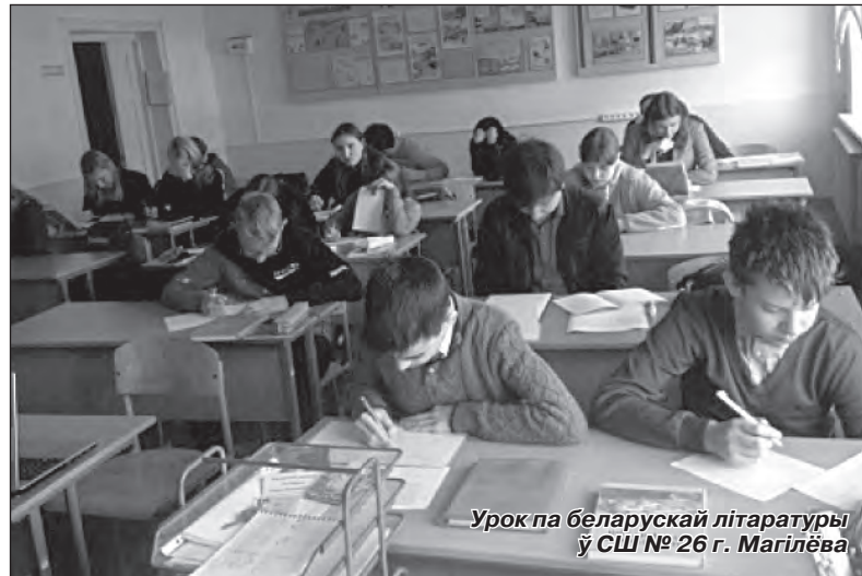
Урок па беларускай літаратуры ў СШ № 26 г. Магілёва

прафесійных навыкаў. Час ляцеў вельмі хутка, і мы нават не заўважылі, як педагагічная практыка падышла да