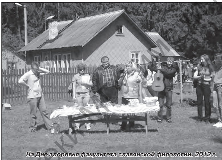
На Дне здоровья факультета славянской филологии. 2012 г.