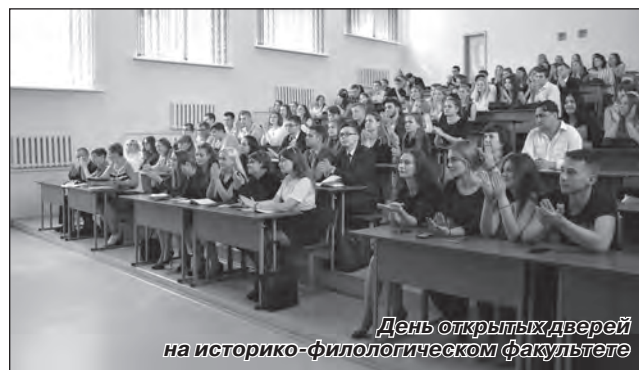
День открытых дверей на историко-филологическом факультете

В этом году впервые была организована приемная кампания с использованием модуля Абитуриент АСУ и внедрена новая модель организации работы приемной комиссии. Работал технический секретариат (8 человек), который обеспечивал ввод первичной информации об абитуриенте. Пользуясь случаем, выражаем благодарность всему техническому секретариату и особую – сотруднику отдела