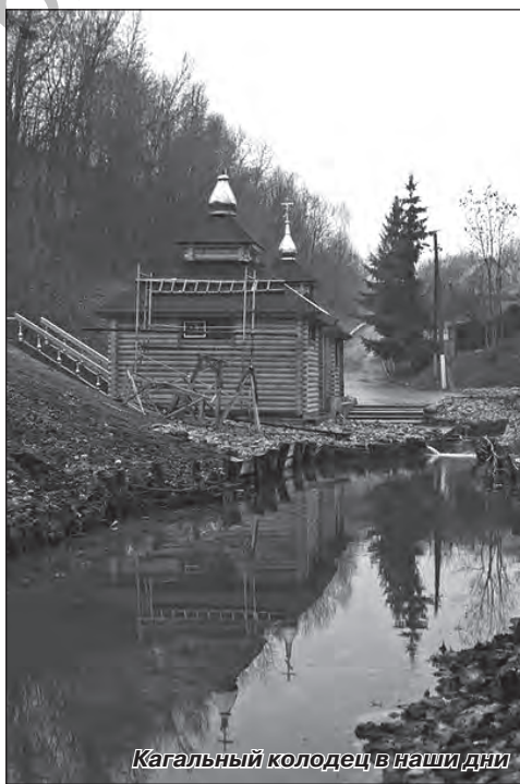
Кагальный колодец в наши дни

Наша страна имеет множество удивительных мест. Это красивые поля и луга, реки и озера. А самое главное – это наши достопримечательности: огромное количество памятников и исторических зданий, которые находятся в одном славном городке. Музей под открытым небом, или Белорусский Суздаль, – так называют город Мстиславль. Именно о нем пойдет речь. Город находится в Могилевской области и граничит с Российской Федерацией. Мстиславль был основан в 1135 году Смоленским князем Романом Ростиславовичем, который назвал его так в честь сына Мстислава. Для множества туристов посетить этот город – главная задача.