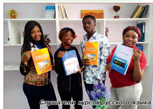
Слушатели курсов русского языка

Вот уже 11 лет ИПКиП оказывает образовательные услуги по обучению иностранных граждан русскому языку. «Первыми ласточками» были слушатели из Туркменистана, а затем с каждым годом география стран расширялась: Турция, Китай, Индия, Пакистан, Япония, Вьетнам, Иран, Ирак, Венгрия и др.