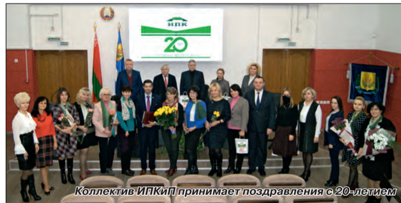
Коллектив ИПКиП принимает поздравления с 20-летием

Российский университет, Гродненский государственный университет и Могилевский и Гродненский областные институты развития образования, Могилевский государственный университет продовольствия, Российский университет дружбы народов, Западно-Казахстанский университет имени М. Утемисова, Ташкентские государственные педагогический и аграрный университеты и др.