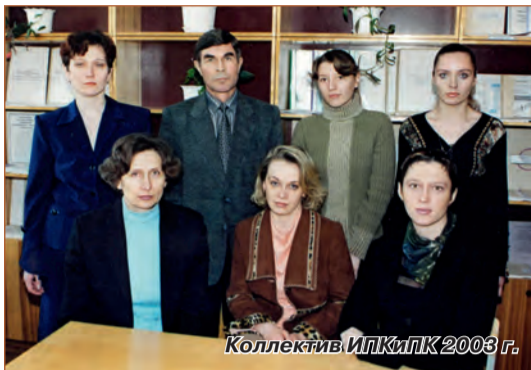
Коллектив ИПКиПК 2003 г.