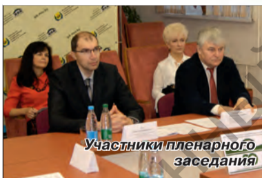
Участники пленарного заседания

Единственная в своем роде на постсоветском пространстве IV Международная научно-практическая конференция «Непрерывное дополнительное образование в государствах-участниках СНГ: опыт, приоритеты и перспективы развития» состоялась 25 ноября 2020 г. в МГУ имени А.А. Куляшова. В этом году конференция впервые прошла в формате онлайн и была посвящена 20-летию Института повышения квалификации и переподготовки.