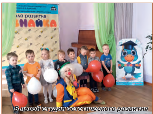
В новой студии эстетического развития

Педагогический коллектив школы составляет команда высокопрофессиональных, эрудированных педагогов, имеющих многолетний опыт работы с детьми. Реализуются как основные программы образования дошкольников («Развиваемся, играя» — для детей 3–4-х лет, «Растем и развиваемся» — 4–5 лет, «На пороге школы» — 5–6 лет), так и дополнительные («Сказкотерапия: гармония и красота души», «Учимся говорить правильно», «Изучаем английский» и др.).