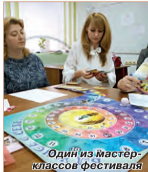
Один из мастер-классов фестиваля

Не стал исключением и нынешний XII-й фестиваль. В работе его десяти площадок (мастер-классов, мастерских, круглых столов) приняли участие более 70 практических психологов и педагогов-практиков из всех регионов Могилёвской области. Главными модераторами в обсуждении острых и дискуссионных вопросов выступили известные и опытные психологи, создатели авторских пси-