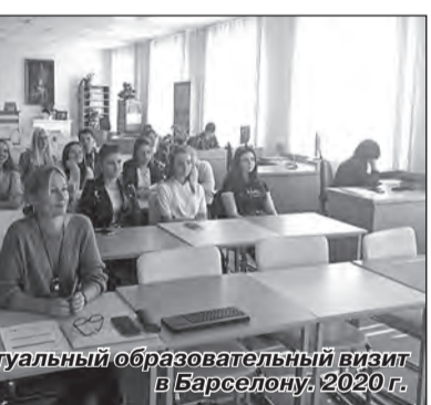
Виртуальный образовательный визит в Барселону, 2020 г.

К разработке содержания всех новых программ практики привлекались представители организаций-заказчиков кадров.