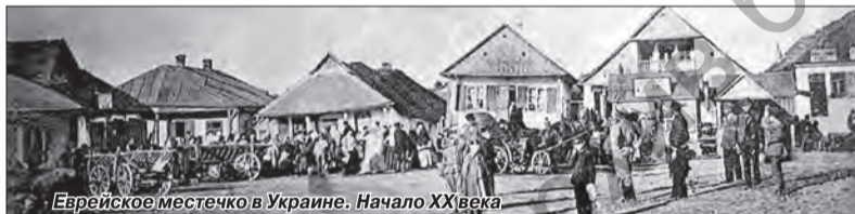
Еврейское местечко в Украине. Начало XX века