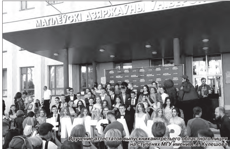
Вручение аттестатов выпускникам третьего областного лицей на ступенях МГУ имени А.А. Кулешова

из них – это удобное для меня расположение: оно находится в моем родном городе. Плюс у меня очень много знакомых, учившихся в этом университете, поэтому я знаю, что там хорошие преподаватели, способные дать необходимый фундамент знаний для дальнейшего проявления себя в выбранных областях. Познакомившись с информатикой ещё в школе, я была сильно ей увлечена. Постепенно осознавая полезность навыков программирования и престиж работы программистом, я начала ещё глубже интересоваться данной темой. Я хочу стать хорошим специалистом в сфере программного обеспечения ИТ и думаю, что обладаю подходящими для