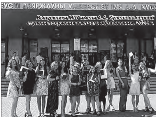
Выпускники МГУ имени А.А. Куляшова первой ступени получения высшего образования, 2020 г.