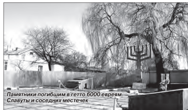
Памятники погибшим в гетто 6000 евреев Славуты и соседних местечек

4 марта 1942 года на рассвете нас, всех евреев, выгнали из своих домов, согнали в школу и там отобрали старых немощных женщин, посадили на повозки, перевезли через реку и в лесу начали расстреливать. Среди обреченных была моя мама. В нее выстрелили, она упала, но осталась жива. Спасло ее то, что она была одета в толстый ватник, и пуля, попав в правую лопатку, только ранила ее. С пулей в теле, в шоке мама выбежала на дорогу. Нас гнали по талому снегу под конвоем вооруженных немцев и под злобный лай собак. Мы не знали, куда нас ведут, но путь был длинным, и многие, не выдержав, па-