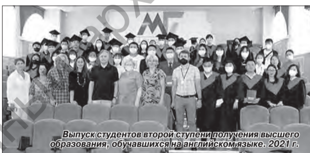
Выпуск студентов второй ступени получения высшего образования, обучающихся на английском языке. 2021 г.

Распределялось 52 чел. со специальностью 2-01 02 01 «Начальное образование» со специализацией