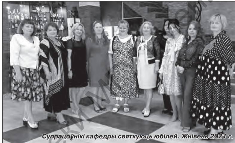
Супрацоўнікі кафедры святкуюць юбілей. Жнівень 2021 г.