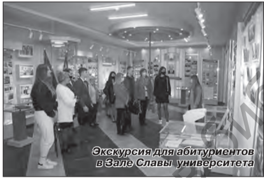
Экскурсия для абитуриентов в Зале Славы университета

В этом году Дню знаний предшествовало важное событие, которое касается каждого из нас – это состоявшийся 23–24 августа 2021 года Республиканский педагогический совет с участием Главы государства. Один из главных постулатов резолюции педагогического совета – политика и идеология в учреждении образования может быть только одна – государственная, и именно в русле государственной политики и идеологии мы обязаны воспитывать наших студентов и слушателей. Напомню и второй постулат – формировать социально-личностные компетенции патриота и гражданина Республики Беларусь не только на отдельных мероприятиях воспитательного характера, но через преподавание дисциплин учебной нагрузки на каждой лекции, семинаре, лабораторной работе или практике.