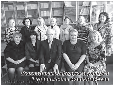
Выкладчыкі кафедры агульнага і славянскага мовазнаўства