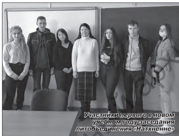
Учаснікі пераго в новым учебном году заседания литобъединения «Натхненне»

Заседание началось с рассказа руководителя литобъединения кандидата