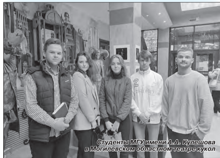
Студэнты МГУ імя А.А. Кулешова в Могилевском областном театре кукол

3 сентября студенты МГУ имени А. А. Кулешова посетили мероприятие, посвященное открытию театральных встреч «Лялькін куФЭр».