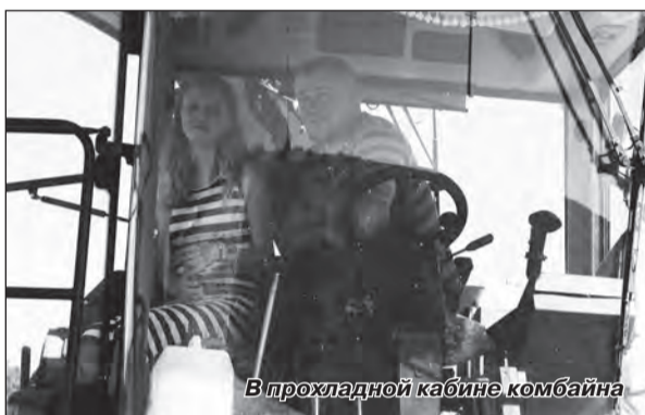
В прохладной кабине комбайна

пробираться. В платях. Эпичное зрелище, не правда ли? Фотокор не упустил такой живописный момент и сделал пару веселых фотографий. В летнюю жару комбайнерам и трактористам приходится работать от восхода до захода солнца, чтобы успеть убрать зерновые до наступления жары. Я никогда раньше не видела комбайн изнутри, поэтому в ответ на мою просьбу посмотреть, что же там, один из работников пригласил меня к себе в кабину. «Смотри, у меня тут кондиционер и даже холодильник есть», – показывал свое рабочее место