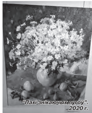
“Пахі знікаючых лугоў”. 2020 г.

Ці можна спыніць імгненне? Фраза з вядомай трагеды Гётэ “Фауст” “Остановись, мгновенье, ты прекрасно” ўжо даўно стала крылатай, што само па сабе з’яўляецца пацвярджэннем таго, колькі разоў звяртаўся чалавек да Бога з просьбай спыніць час, каб хоць яшчэ на трошчкі працягнуць адчуванне прыгажосці, захаплення, адзінства з каханым чалавекам.