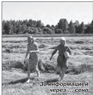
За информацией через... сено

Утро 7 июля не предвещало ничего веселого. Журналисты районной редакции занимались своими делами. Кто-то верстал газету, кто-то пытался найти вдохновение, а кто-то договаривался о встрече. На часах было около 11 дня, когда заместитель главного редактора сообщил: «Сегодня едем на район!». Я была ошарашена, но предвкушение от поездки отодвинуло страх на задний план. Это был мой выезд на район, который запомнился надолго.