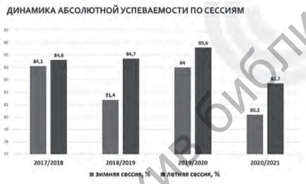
ДИНАМИКА АБСОЛЮТНОЙ УСПЕВАЕМОСТИ ПО СЕССИЯМ