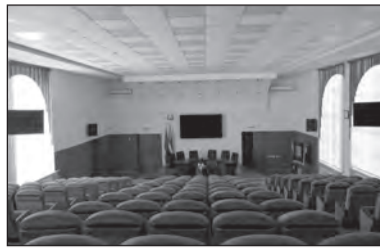
Конференц-зал после реконструкции

Для укрепления материально-технической базы университета за 2018/2019 год была проделана большая работа: только в учебном корпусе №1 проведена частичная замена оконных (51 шт.) и дверных блоков на ПВХ, в аудитории 301 проведен современный ремонт и заменена мебель, введен в эксплуатацию малый концертный зал, конференц-зал, произведен частичный ремонт в буфете на первом этаже; в учебном корпусе №1а заменена входная группа с фронтальными витражами и проведен ремонт фойе. Во всех учебных корпусах и общежитиях выполнен