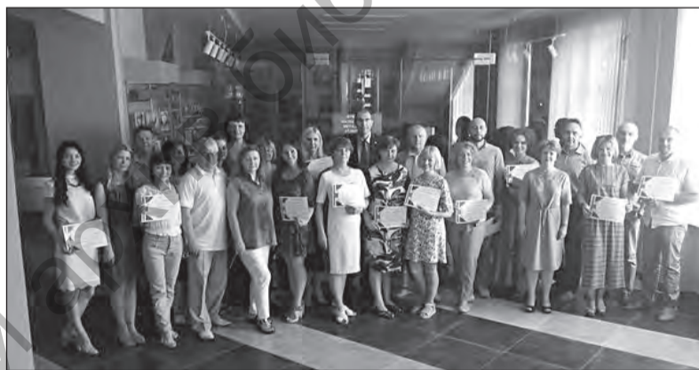
Выпускники первых обучающих курсов по английскому языку для преподавателей

рейтинговой системы является ее антикоррупционная направленность: системная работа в семестре не предполагает сложности при сдаче студентом экзамена, зачета.