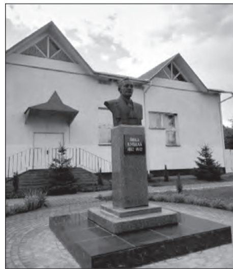
Помнік Янку Купалу

14 ліпеня разам з сябрамі Таварыства беларускай мовы імя Ф. Скарыны я адправіўся ў вандроўку на Купалаў фэст, які праходзіў у Радашковічах. Ужо не першы раз ТБМ горада Магілёва наведвае гэты фэст з нагоды ўшанавання памяці выдатнага беларускага пісьменніка Янка Купала.