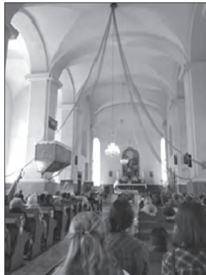
Касцёл Найсвяцейшай Тройцы

Вельмі ўразіла прыгажосць Радашковіч: прыгожыя дамы, гандлёвыя цэнтры, помнікі беларускім пісьменнікам. Мы пайшлі да касцёла Найсвяцейшай Тройцы, на тэрыторыю якога праходзіў Купалаў фэст. Паслухалі верш «Мая малітва» пад гукі старадаўняга аргана. Далей выступілі арганізатары фэсту, Марыя Міцкевіч – унучка Я. Коласа і Я. Маўра. Потым усе жадаючыя чыталі вершы, праводзілі міні-спектаклі, ушаноўвалі гасцей фэсту.