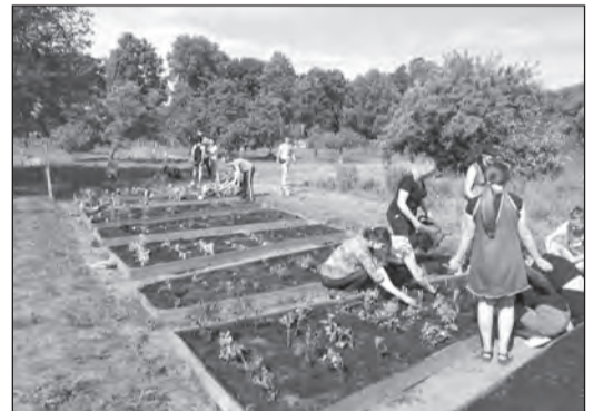
Высадка лекарственных растений

Однако пасека – это, конечно, и продукты пчеловодства, важнейший из которых – мед. В 2019 г. впервые