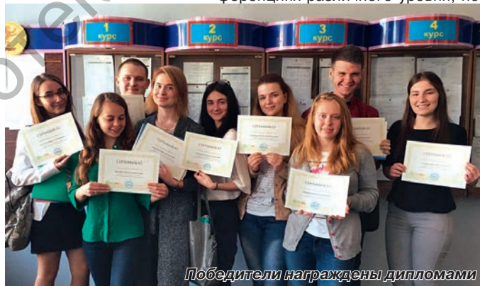
Победители награждены дипломами

Преподавательский состав кафедры занимается выполнением кафедральной темы «Совершенствование механизма экономического развития региона», участвует в научных конференциях различного уровня, по-