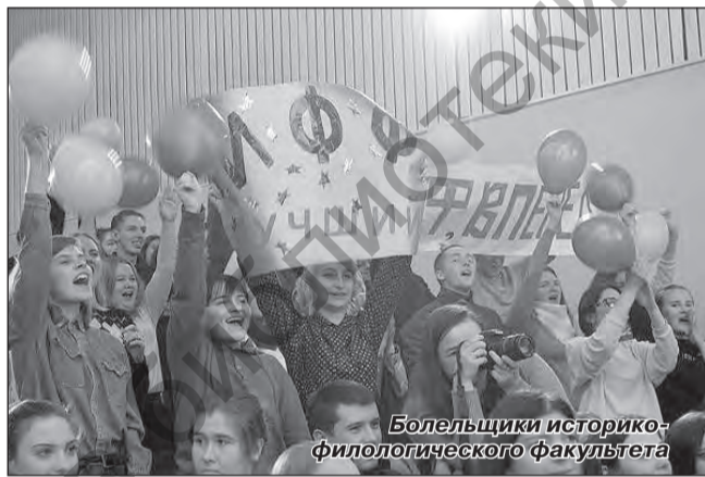
Болельщики историко-филологического факультета