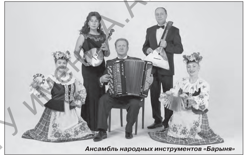
Ансамбль народных инструментов «Барыня»