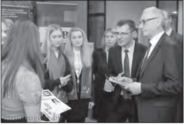
Студенты представляют проект

Специальность «журналистика» в нашем университете является особенно молодой. Обучение студентов этой специальности отличается от системы преподавания других предметов, многие из них преподают журналисты-практики. Эти журналисты знают всю «кухню» изнутри, и поэтому вполне нормально, что вместо лекций, они со студентами проводят опросы на улицах, учат делать видеосюжеты, работают в радиостудии и смотрят, как работают люди, которые находятся по другую сторону экрана. Именно такое образование делает из любителя «писать красиво» профессионального журналиста.